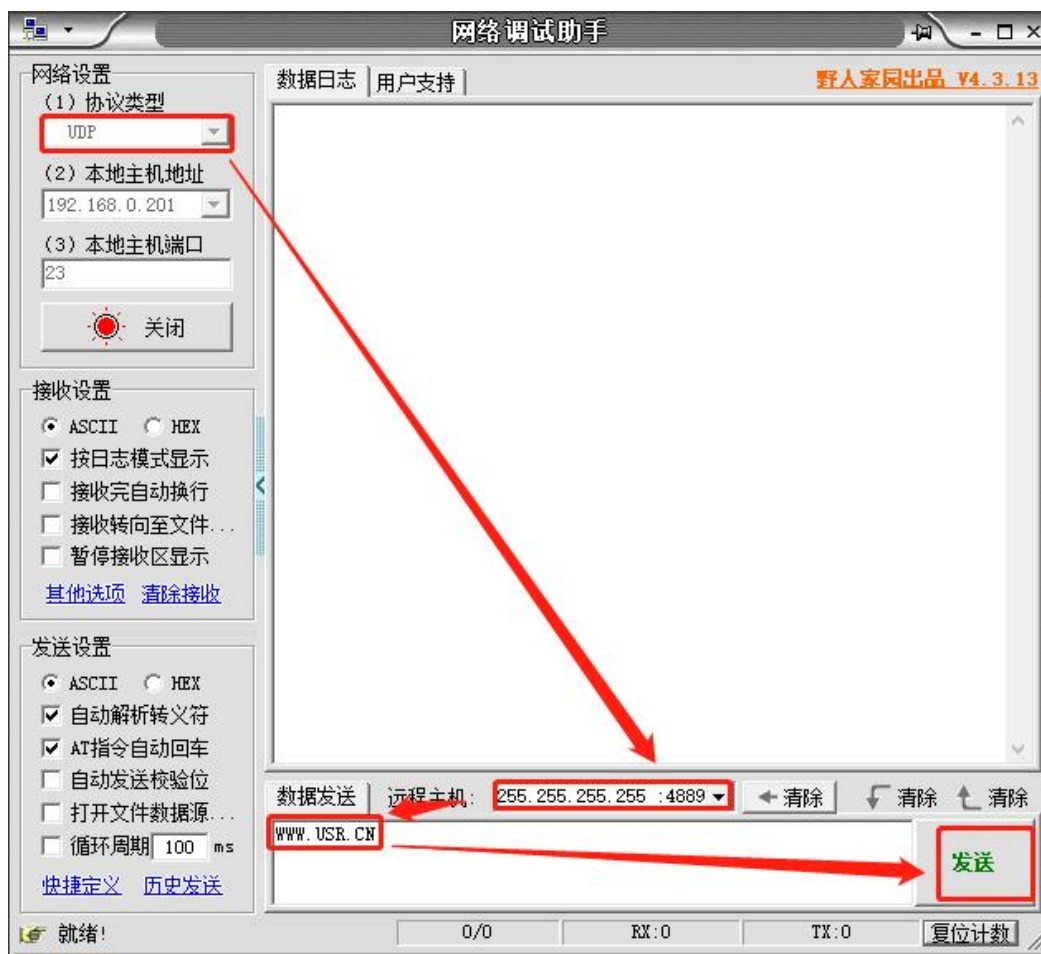
图 1 准备进入网络 AT 模式

通过网口 UDP 广播发送向端口 48899(远程主机设置为 255.255.255.255:48899)发送 WWW.USR.CN，如果模块和电脑在同一网段内，则会收到模块回复的信息。