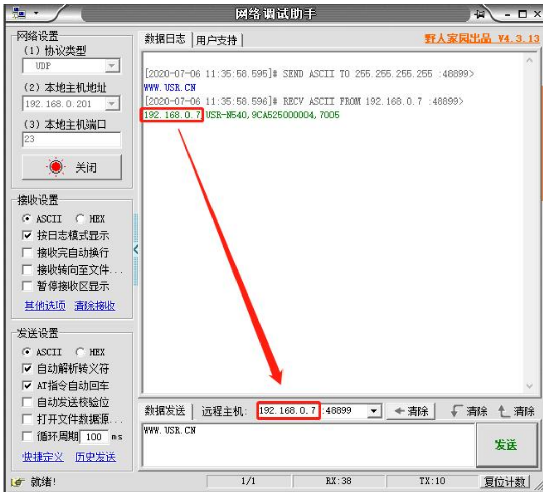
图 2 已进入网络 AT 模式

此时表明模块已经进入网络 AT 指令模式，如果挂载多个设备，使用广播会有多个设备同时回应，此时只需要修改远程主机 IP，与自己的设备 IP 保持一致。