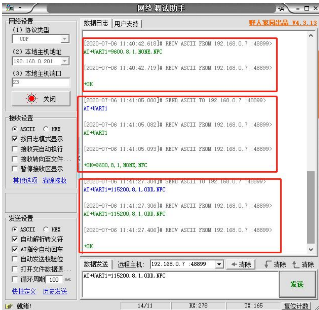
图 3 网络 AT 指令设置和查询