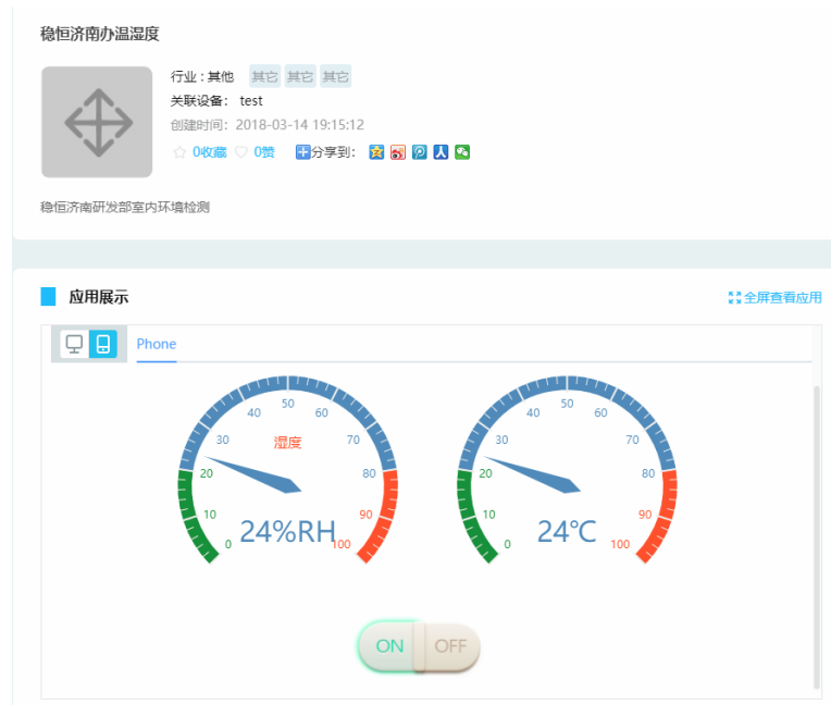
图 2 案例效果图

WH-NB73_应用案例_移动 OneNET: http://www.mokuai.cn/download/186.html