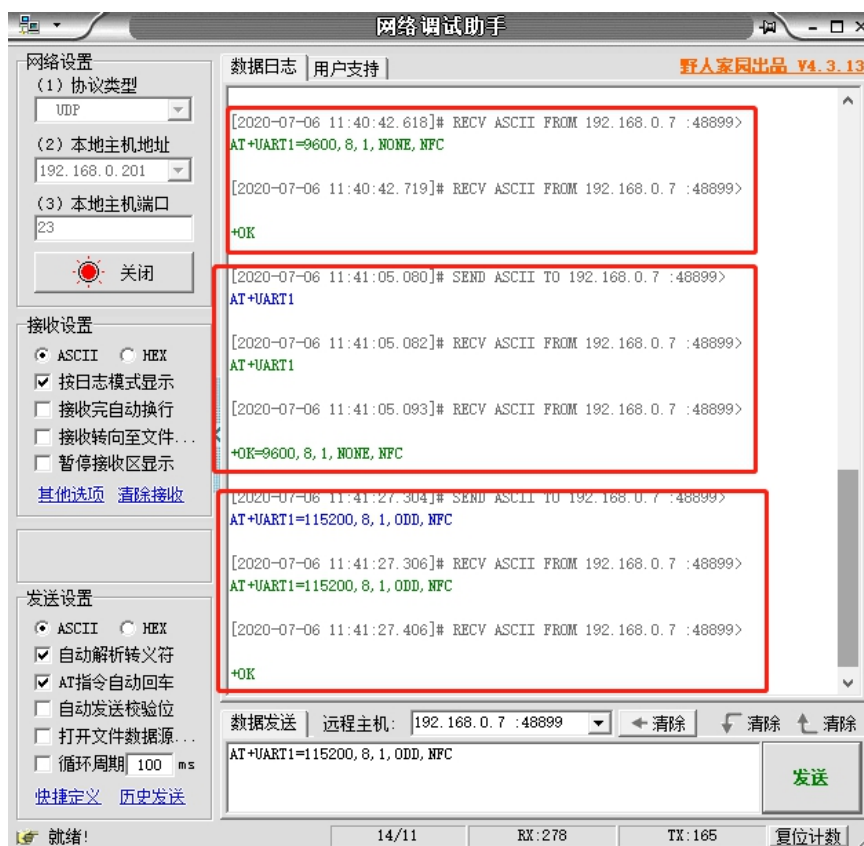
图 3 网络 AT 指令设置和查询

使用网络 AT 设置和查询基本一致，以下图设置串口参数为例，修改串口的波特率由 9600 到 115200、修改校验位由 NONE 到 ODD：