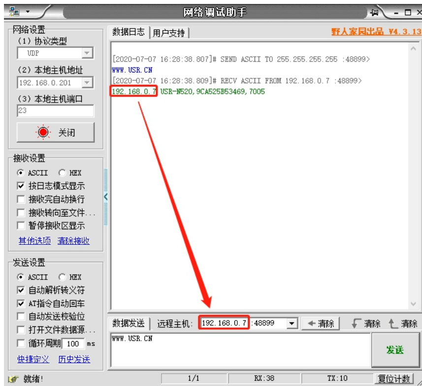
图 2 已进入网络 AT 模式

此时表明模块已经进入网络 AT 指令模式，如果挂载多个设备，使用广播会有多个设备同时回应，此时只需要修改远程主机 IP，与自己设备的 IP 保持一致。