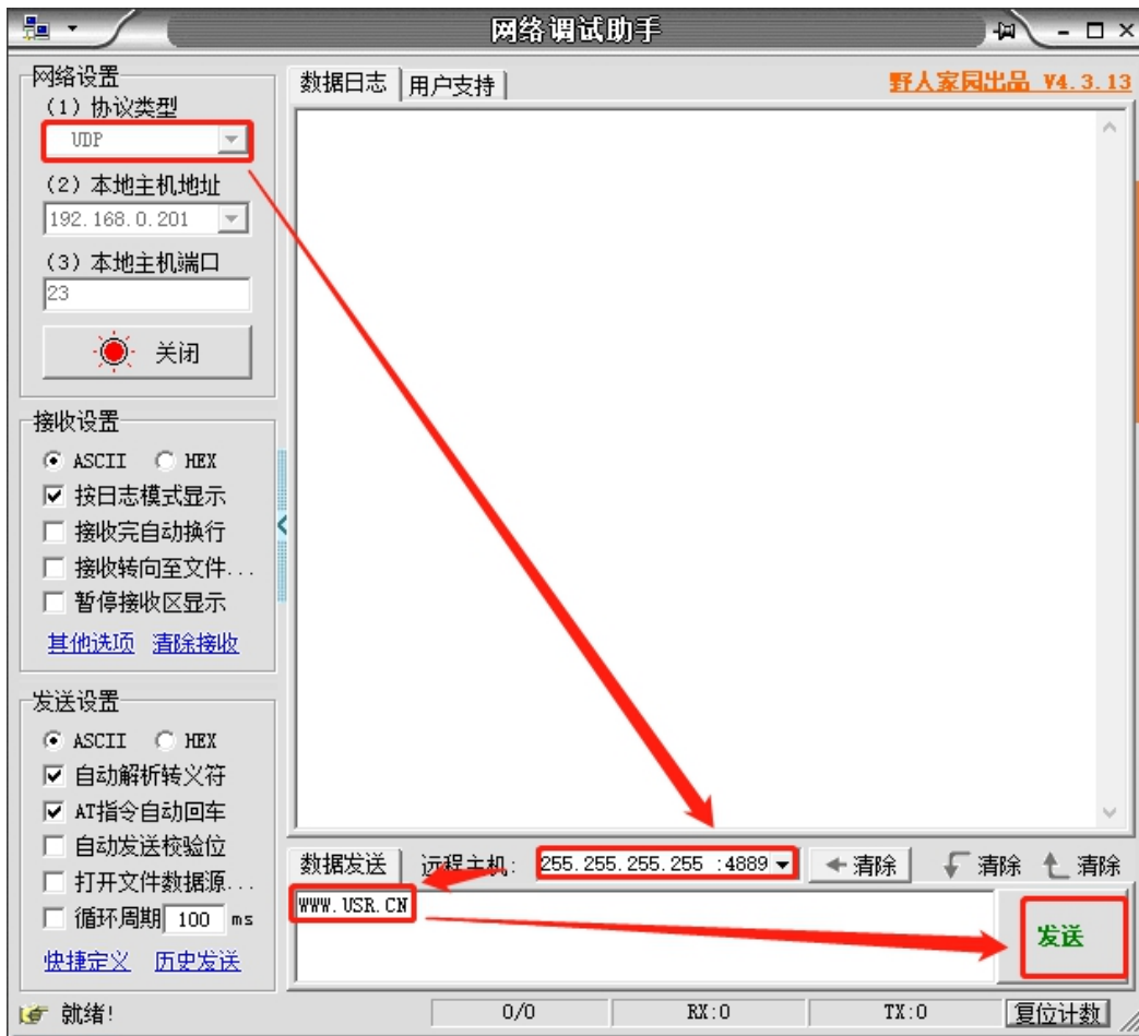
图 1 准备进入网络 AT 模式

通过网口 UDP 广播发送向端口 48899(远程主机设置为 255.255.255.255:48899)发送 WWW.USR.CN，如果模块和电脑在同一网段内，则会收到模块回复的信息。